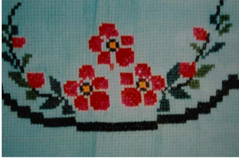
Fotoğraf 6. "Bir Avuç Altın" İsimli Esvap (Elbise) Örtüsünde Detay