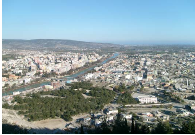
Foto 1. Silifke Şehir Merkezinden Bir Görünüm