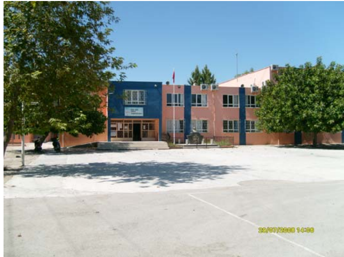
Foto 2. Şehir Merkezinde Bulunan Göksoy İlköğretim Okulu