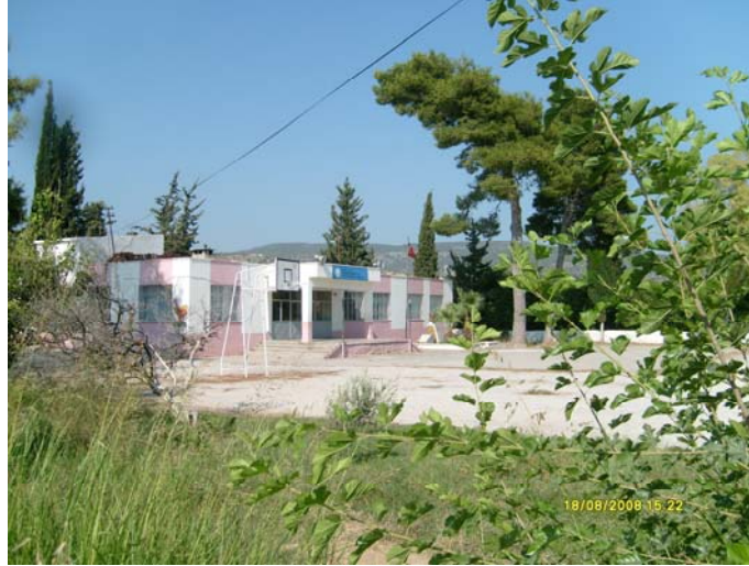
Foto 4. Birleştirilmiş Sınıflı Eğitim Veren Kabasakallı İlköğretim Okulu