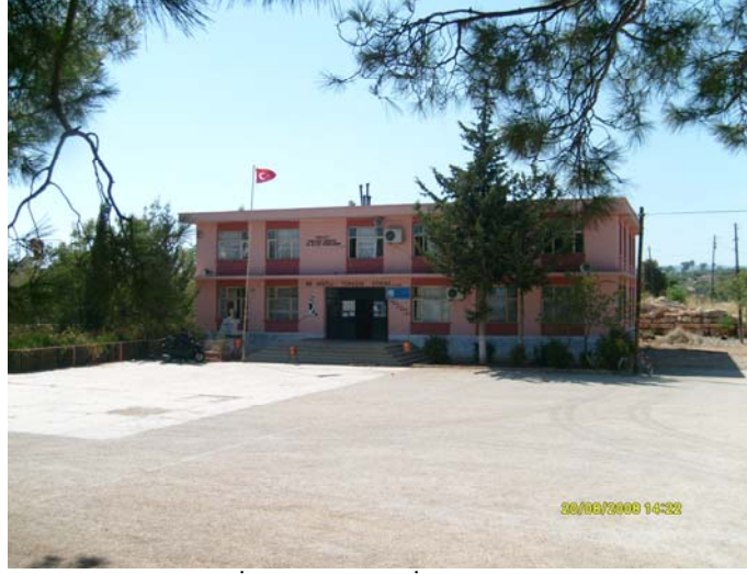
Foto 3. İmamlı Köyü İlköğretim Okulu