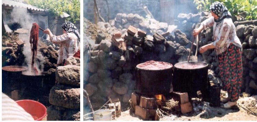
Görsel 1. Ayvacık İlçesi Bektaş Köyünde Halı İplerinin Kökboya ile Boyanması

Halı ipliklerinin boyanmasında kullanılan boyarmaddelerin, ışık ve yıkama haslıklarının düşük olması, halının renginin solmasına ve ilk günkü çekiciliğini ve parlaklığını kısa sürede yitirmesine sebep olmaktadır. Halı iplikleri, ışık ve yıkama etkilerine karşı direnci yüksek boyar maddelerle boyanmalıdır.