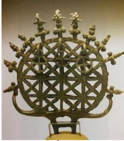
Resim 7. Kâinatı Simgeleyen Törensel Âlem (Anadolu Medeniyetler Müzesi Kataloğu, s. 73)