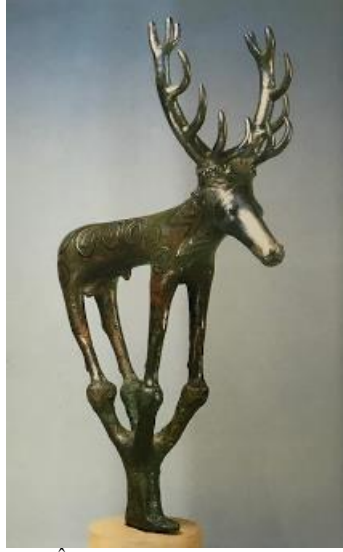
Resim 10. Geyik Figürlü Törensel Älem, Alacahöyük (Anadolu Medeniyetler Müzesi Katalođu, s. 66)

Anadolu'da bulunan Tunç Çađı'na ait eserlerdeki hayvan sembolizminin etkisi bugün Türkiye Cumhuriyeti'nde de devam etmektedir. Alacahöyük'te bulunan, bir erkek alageyik ile her iki yanında duran iki boğanın yer aldığı "güneş kursu"na (hatalı bir şekilde Hitit güneş kursu olarak isimlendirilen) ait anıtsal bir rekonstrüksiyon, Ankara Sıhhiye Meydanı'nda yer almaktadır (Res. 11). Ayrıca Alacahöyük güneş kursu, Ankara Üniversitesi'nin, bir Türk markası olan Eti'nin ve Çorum Belediyesi'nin logosu olarak kullanılmaktadır. Zaman içerisindeki bu deđişikliklere rağmen bu hayvanlar her çağda, her toplumda zengin ve önemli sembolik anlatımın kaynakları olmuşlardır (Alp S. , 2003, s. 2-7; Arbückle, 2020).