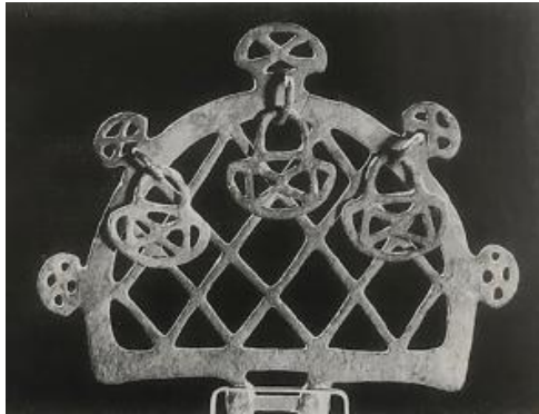
Resim 8. Çok Başlı Kültepe İdollerine Benzer Törensel Âlem (Akurgal, 2005, s. 24)

süsleridir. Belirli standartlar tarafından temsil edilen tanrıları belirlemek için girişimlerde bulunulmuş, güneş kursu genellikle Güneş Tanrısı, boğa Fırtına Tanrısı, geyik Koruyucu Tanrı olarak kabul edilmiştir (Popko, 1995, s. 45, 46).