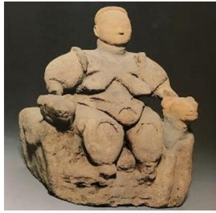
Resim 3. Tanrıça Heykelciği, Çatalhöyük (Kulaçoğlu, 1992, s. 40)

Diğer taraftan Boğazköy'de bulunmuş metinlerden leoparın Hatti tanrıları İnara, Tanrıça Teteşhapi ve Güneş Tanrıçası ile yakın ilişki içinde olduğu anlaşılmaktadır. Ayrıca Anadolu tasvir sanatında leopar ile ilişkili tanrılar arasında; Tanrıça Hepat ve oğlu Şarruma gelmektedir. Yazılıkaya 3 ana galerisinde Tanrıça Hepat ve oğlu Şarruma leoparlar üzerinde ayakta dururken tasvir edilmişlerdir (Ünal, 1984, s. 604, 605; Oral, 2021, s. 641) (Res. 4). Hitit panteonu, başında ilk çiftin yer aldığı büyük bir aile olarak algılanmıştır. Bu ilk çift, Hitit ülkesinin koruyucuları olan Fırtına Tanrısı ve bir Ulu Tanrıça'dır. Fırtına Tanrısı daha çok Hurri dilindeki ismiyle, Teşup, eşinin adı Hepat olarak geçmektedir. Fırtına Tanrısı'nın kutsal hayvanı boğa ve Hepat için ise aslan (veya panter) tarih öncesinden beri var olan bir sürekliliği doğrulamaktadır (Eliade, 2003, s. 177).