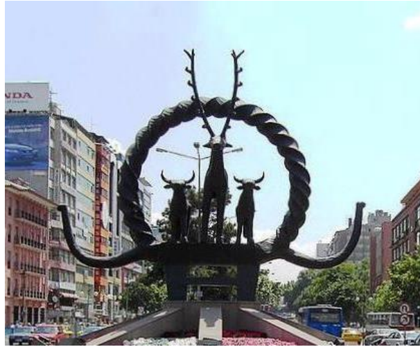
Resim 11. Ankara Sıhhiye Meydanı'nı Süsleyen Anıt Hatti Monument - Hitit Güneş Kursu Anıtı - Wikipedi (wikipedia.org) (18.01.2023)