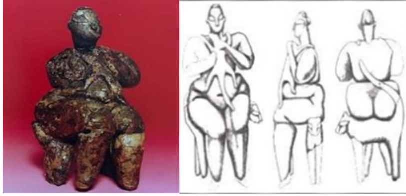
Resim 2. Leoparlı Tanrıça Heykelciği ve Çizimi, Hacılar (Kulaçoğlu, 1992, s. 55) (Duru, 2016, s. 144)