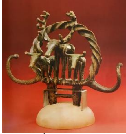
Resim 9. Geyik ve Boğa Figürlü Törenselle Âlem, Alacahöyük (Anadolu Medeniyetler Müzesi Kataloğu, s. 71)

Sonuç olarak avcı-toplayıcı ve tarım toplumlarının hayatlarında önemli bir yeri olan boğa, eski çağ toplumları için dinsel bir anlam ifade etmiş ve tanrısallık sembolü olarak kullanılmıştır. Boğanın hangi dönemden itibaren sembolleştiği tam olarak bilinmese de Paleolitik Çağ'dan itibaren bu tür boynuzlu hayvan figürleri tasvir edilmiştir. Tunç Çağ'ında özellikle Hititlerde ve daha sonraki MÖ 1. binyılda boğa, Fırtına Tanrısı Teşup, Luvi Bölgesi'nde ise Tarhunt'un simgelerinden biri olmuştur. Eski Yunan-Roma'da boğa, Zeus ve Jupiter'in en önemli sembolleri arasında yerini almış ve boğa kurbanı, tanrılara sunulan en zengin hediyeler arasında gösterilmiştir (Kılıç & Turgut, 2016, s. 775-777). Anadolu'da MÖ 13. yüzyılda geyik ve boğa aynı anda tapınım görmüştür. Boğa ve geyik tapınımı özellikle Alacahöyük kral mezarlarında bulunan bir çok kült nesnesi ile kanıtlanmaktadır. Bu kült nesnelereinden biri, iki tarafında çıkıntılı boynuzlar olan ve üzerinde yay şeklinde burgulu bir kemer bulunan âlemden oluşmaktadır. Burgulu kemerin altına ve sahnenin merkezine bir geyik ve iki yanına daha küçük iki hayvan yerleştirilmiştir (Res. 9). Küçük hayvanların boynuzlarından boğa oldukları anlaşılmaktadır. İri boyutları ve gösterişli boynuzlarıyla dikkat çeken geyik bu kompozisyonda özel bir rol oynamaktadır (Przeworski, 1940, s. 72, 73).