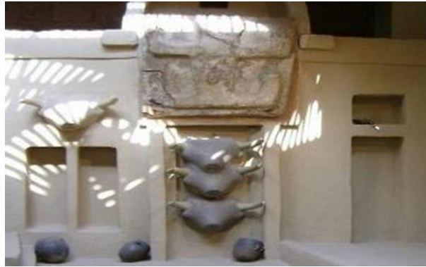
Resim 5. Boğayı Doğuran Kadın Kabartmasının Bulunduğu Yapının Rekonstrüksiyonu, Çatalhöyük