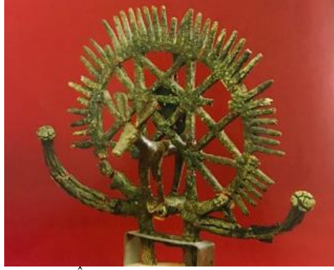
Resim 6. Törensel Âlem (Anadolu Medeniyetler Müzesi Kataloğu, s. 72)

âlemlerde boğa, geyik, aslan gibi hayvan heykelciklerinin tanrı ve tanrıçaların sembolleri olduğu düşünülmektedir. Ayrıca Alacahöyük güneş kurslarındaki hayvanların hayvan şekilli tanrıları ve güneş kursunun tamamının ise bir “kâinatı” temsil ettiği varsayılmaktadır. Örneğin çift boğa boynuzu üstünde, bir hayvan heykelciğinin etrafını çevreleyen çelenkten çıkan ışınlar, bütünüyle bir güneşi anımsatmaktadır. Böylece bu tür âlemlerin kâinatı canlandırdıkları düşünülmektedir (Res. 6, 7). Işınsız çelenk biçimli âlemler ise gökyüzü yuvarlağını canlandırmaktadır. Bu kâinat kuşağının ortasında yer alan hayvan heykelciklerinden her biri de tanrıları simgelemektedir (Akurgal, 2005, s. 23) (Res. 8).