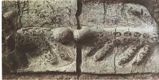
Resim 1. İki Leoparın Tasvir Edildiği Kabartma, Çatalhöyük (Mellaart, 1988, s. 92)

Prehistorik Çağ insanının modern yorumu kadını hep bitkilerle, erkeği ise hayvanlar dünyasıyla özdeşleştirmiştir. Paleolitik Çağ'da genellikle hayvanlarla ve hayvan kılığında tasvir edilen erkeklere alışılmıştır. Ancak Neolitik Çağ ile farklı bir manzara karşımıza çıkmaktadır. Şişman kadınlarla birlikte vahşi kedigiller tasvir edilmiştir. Bu tasvir geleneği artık ezberleri bozmuştur. Genellikle iki yanında kedigillerden vahşi hayvanlarla tasvir edilen kadın heykelcikleri doğaya ve vahşi yaşama egemen olduğu düşünülen Ana Tanrıça ile özdeşleştirilir (Gezgin, 2021, s. 88). Bu heykelciklerle insanların normal etkinliklerinin ötesindeki konularla betimlenmiş olması, olağan hayatta karşılaşılmayacak bir sahnenin tasvir edilmesi oldukça şaşırtıcıdır. Bazı kadınlar bebeğini kucaklayan bir anne pozunda, kedigillerden hayvanları bağrılarına basmaktadırlar (Roller, 2013, s. 58). Bu tür sahneler tanrıçanın hayvanlar üzerindeki hâkimiyetini düşündürdüğü gibi koruyucusu olduğunu da düşündürmektedir. Dolayısıyla leopar ve kadın arasında güçle alakalı bir ilişki olduğu açıktır. Zira aslan ve leopar Neolitik Çağ'dan itibaren Göbekli Tepe ve Çatalhöyük gibi yerleşmelerde Anadolu coğrafyasının bir parçası olarak ikonografide yerini almıştır (Arbückle, 2020). Leopar, Anadolu'daki Ana Tanrıça'nın bir sıfatı olarak kabul edilmiştir (Aydın, 2005, s. 148).