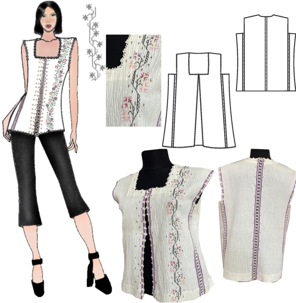
Şekil 4. Tasarım 2 Basit Nakış Teknikleri ile Süslenmiş Yelek Tasarımı

Tasarım 2' de basit nakış tekniği simetrik kesimli bir yelek tasarımına uygulanmıştır. Kıvratma kumaştan kesilen yeleğin yaka ve kol evi kare formlu olup, ön ortası açık, kapamasız tasarlanmıştır. Krem rengi kıvratma kumaşın eni dardır ve her iki kenarı mor boyuna çizgilidir. Dokuma eninin dar olması nedeniyle kol altına peş parçası yerleştirilerek yelek genişletilmiştir. Giyside süsleme sol ön bedende omuz ve etek ucu arasına dikey olarak mor, sarı, açık pembe ve siyah tek kat molina iplik ile uygulanmıştır. Omuz ve etek ucu arasına bitkisel motif kaneviçe tekniği ile işlenmiştir. Kaneviçe arasına, ön ortasına, yaka çevresine ve arka ortasına gold renk iplik ile işlenen tel kırma tekniği hareketlilik kazandırmıştır. Ön ve arka bedende kol evi ile etek ucu arasına ve arka bedende arka ortasına aradanteli şeklinde elde örülen dantel yerleştirilmiştir. Yaka çevresi, ön ortası, kol evi tuğ battı tekniğiyle tülben kenarı oyası ile temizlenmiş ve süslenmiştir.