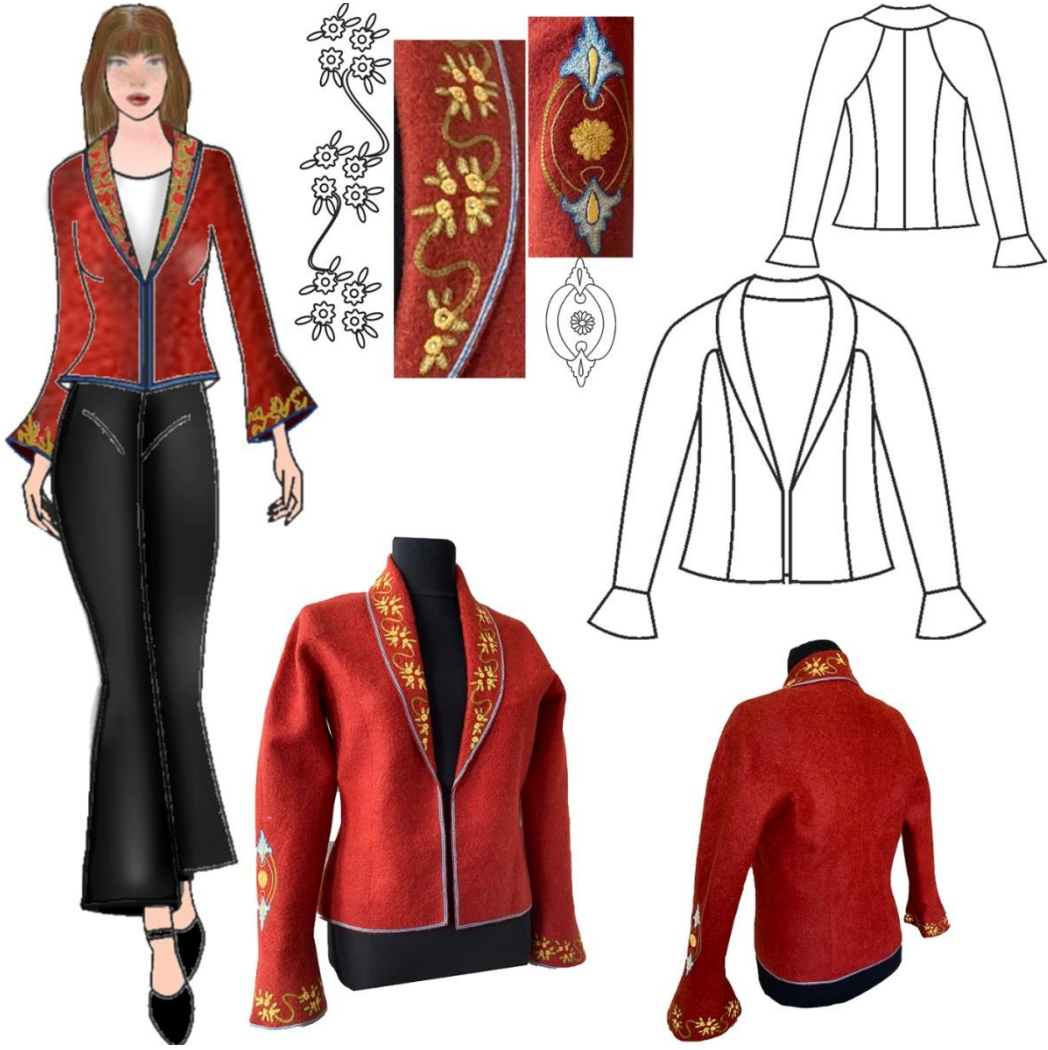
Şekil 5. Tasarım 3 Basit Nakış Teknikleri ile Süslenmiş Ceket Tasarımı

Tasarım 3'te basit el nakış teknikleri simetrik kesimli bir ceket tasarımına uygulanmıştır. Ceketinde tepme keçe yöntemiyle elde edilen kiremit rengi keçe kullanılmıştır. Yaka açıklığı bel hattına kadar inen şal yakalı ceketinde kollar reglan kol formunda olup kol boyu bilek hizasındadır. Kol ağzı keçenin volanlı kesimi ile genişletilmiştir. Giysi bedene ön ve arka bedende omuzdan inen kuplarla oturtulmuştur. Giyside süsleme, şal yaka üzerine, ön ortası ve etek ucuna, kol ağzına ve dirsek hattına uygulanmıştır. Yaka ve kol ağzında bitkisel motif tohum işi, sarma, zincir iğnesi teknikleri ile oluşturulmuştur. Dirsekte stilize edilmiş sırt sırta bakan palmetler ve iki palmet arasında bulunan çiçek motifi elde sarma tekniği ile oluşturulurken aralarına uygulanan zincir işi motifleri birbirine bağlamaktadır. Ceketinde yaka çevresine, ön ortasına, etek ucuna ve kol ağzına mavi renk tek kat molina iplik ile çift sıra zincir iğnesi uygulanmıştır.