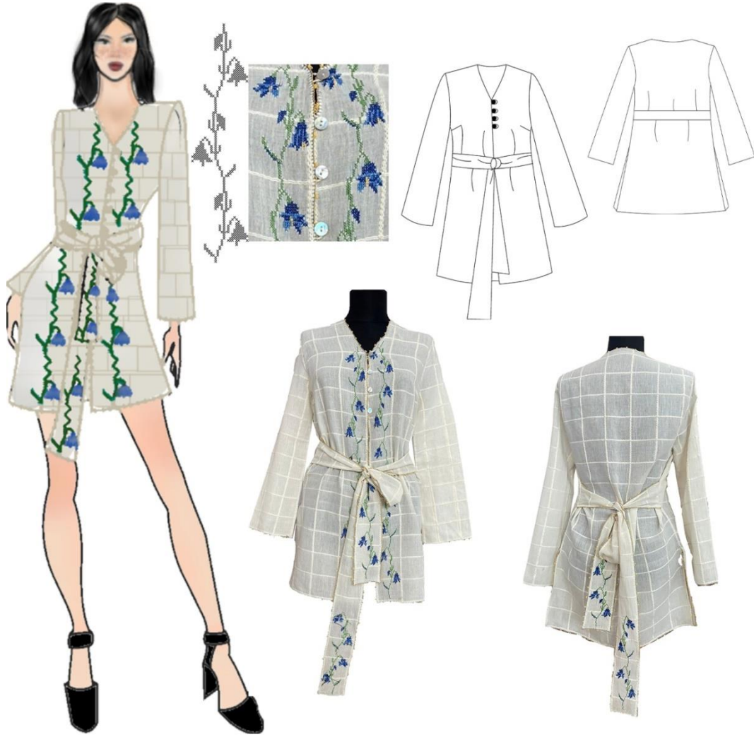
Şekil 10. Tasarım 8 Basit Nakış Teknikleri ile Süslenmiş Bluz Tasarımı

Tasarım'8 de basit nakış teknikleri simetrik kesimli bir bluzaya uygulanmıştır. bluzada krem rengi üzeri kendinden kareli dokuya sahip buldan bezinden dikilmiştir. Giysiye "V" yaka uygulanmıştır. Ön ortası bele kadar birit ilik ile kapatılmış belden aşağısı açık, kapamasız bırakılmıştır. Düz takma kol formunda olan kolların model boyu bilek hizasına kadar uzun olup kol ağzı geniş çalışılmıştır. Kol alt dikişine uygulanan göğüs penci ile giysiye göğüs formu verilmiştir. Bel hattında yan dikişlerden çıkan kemer giysiye süsleme özelliği kazandırmanın yanı sıra bluzun bedene oturmasını de sağlamaktadır. basit nakış teknikleri bluzda ön bedende ön ortasında sağ ve sola simetrik olarak işlenmiştir. İşlemlerde kumaşın üzerine sökülebilir kanaviçe yerleştirilerek bitkisel desenlerde kavaviçe işi işlenmiştir. İki ayrı mavi tonu ve yeşil rekte koton domino iplik ile işlenen desen ön bedende yaka açıklığından etek ucuna kadar uzunlamasına işlenmiştir. Aynı desen yan dikişlerden çıkan kemerde etek ucuna da işlenerek giysiye süsleme özelliği kazandırılmıştır. Bluzun yaka çevresi, ön ortası, kol ağzı, kemer çevresi sarı renkli koton domino iplik ile daha çok çember kenarı temizlemede kullanılan iğne oyası, bülbül tükrüğü ve zürafa ile temizlenmiştir.