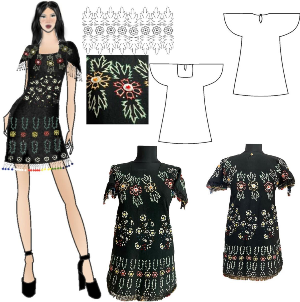
Şekil 9. Tasarım 7 Basit Nakış Teknikleri ile Süslenmiş Elbise Tasarımı

Tasarım 7'de basit nakış teknikleri simetrik kesimli bir elbiseye uygulanmıştır. Elbisede Tokat yöresine ait tahta baskılı yazma, pamuklu astarlık kumaş ve elyaf kullanılmıştır. Giysiye kare yaka uygulanmıştır, yakaya arka bedende yırtmaç çalışılmıştır ve yırtmaç birit ilik ile kapatılmıştır. Kollar bedenden çıkan kol formunda, kol alt dikişi ve omuz arası dışa doğru kavisli şekilde kesilerek oluşturulmuştur. Giyside omuzlar dikişsiz olup ön ve arka beden birlikte kesilmiştir. Elbisede kullanılan Tokat yazması süslemede kullanılan basit nakış iğneleri ile elyafa sabitlenmiştir. Süslemede basit nakış iğneleri yazma desenleri referans alınarak oluşturulmuştur. Desenlerin üzerine farklı renklerde koton domino ipliklerle elde makine iğnesi işlenmiştir. Çiçek ortalarına sedef düğmeler küçük renkli cam boncuklar tutturulmuştur. Dağınık çiçek motifleriyle oluşturulan kompozisyonların aralarına farklı renklerde cam boncuklar tutturulmuştur. Elbisede kol ağzı ve etek ucu boncuklarla desteklenerek oluşturulan firkete oyası ile hareketlendirilmiştir.