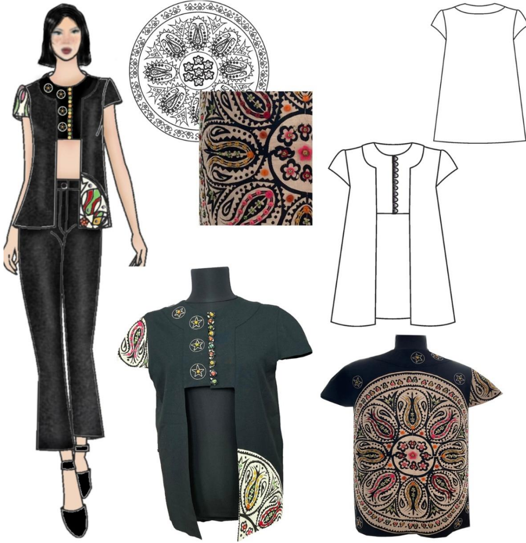
Şekil 6. Tasarım 4 Basit Nakış Teknikleri ile Süslenmiş Bluz Tasarımı

Tasarım 4'te basit el nakış teknikleri simetrik kesimli bir yeleğe uygulanmıştır. Yelekte siyah gabardin kumaş ve Tokat yöresine ait tahta baskı ile desenlendirilmiş, sofrta bezlik kumaş kullanılmıştır. Sıfır yakalı yeleğin ön ortası göğüs hattına kadar sık yerleştirilen, kumaşın kendisiyle kaplanmış düğmeler ve birit ilik ile kapanmıştır. Yaka çevresi ve ön ortası göğüs hattına kadar pervaz ile temizlenmiştir. Göğüs hattından etek ucuna kadar ön sağ ve sol bedende pervaz genişliği kadar açıklık verilmiştir. Kollar düz takma kol formunda olup kol boyu kol altını açıkta bırakacak şekilde tasarlanmıştır. Giyside süsleme asimetrik bir düzen dâhilinde yapılmıştır. Giysinin ön bedende sağ kolu, sağ beden yaka pervazı ve sol beden etek ucu ile arka beden applike edilen kumaş üzerinin işleme ile oluşturulmuştur. Yelekte, Tokat yöresine ait sofrta bezlik kumaş gabardin üzerine basit nakış teknikleri kullanılarak applike edilmiştir. Desen üzerine yassı bocuklar ve küçük keçe parçaları basit nakış iğnelerinden papatya iğnesi, zincir iğnesi ve boncuk tutturma teknikleri ile birleştirilmiştir. Yakada pervaz üzerine uygulanan applike de yıldız motifleri elde makime tekniği ile uygulanmıştır.