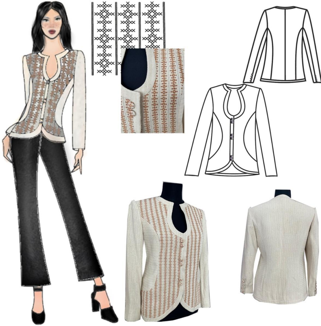
Şekil 3. Tasarım 1 Basit Nakış Teknikleri ile Süslenmiş Ceket Tasarımı

Tasarım 1’de basit el nakış tekniği simetrik kesimli bir ceket tasarımına uygulanmıştır. Ceket, yarı otomatik el tezgâhında dokunan Hatay yöresi ipek ve pamuk karışımı, bej renkli bir kumaş kullanılmıştır. Giyside yaka boyun çevresinde hafif oyuntulu olup ön ortası göğüs hizasına doğru “U” şeklinde bir açıklığa sahiptir. Giysi ön ve arka bedende kol evinden çıkan kuplarla vücuda oturtulmuştur. Ceketin yaka çevresi ön ortası ve etek ucu enkrüste pat ile temizlenmiştir. Ön ortasında kapama, kendi kumaşı ile kaplanan düğme ve ilik ile sağlanmıştır. İki parçalı düz takma kol formunda olan kollar bilek hizasındadır. Kol ağzı dar kesimli ve yırtmaçlıdır. Yırtmaç üzeri kanaviçe nakışı, kumaş ile kaplanan düğmeler ile hareketlendirilmiştir. Giysinin ön bedeni basit nakışı tekniklerinden ajur ve kanaviçe ile süslenmiştir. Basit nakış teknikleri ceketle kumaş özelliğinden yararlanılarak oluşturulmuştur. Ajur 2 cm aralıklarla yan yana dikey olarak kumaş ipliklerinin boyuna çekilmesi ile oluşturulmuştur. Ajur yapımında beyaz renkli dikiş ipliği kullanılmıştır. Kanaviçe, ajurlar arasında kalan boşluklara simetrik bir düzende işlenmiştir. Birbirine boyuna paralel olacak şekilde ajurlar arasına işlenen kanaviçede kahverengi domino iplik kullanılmıştır