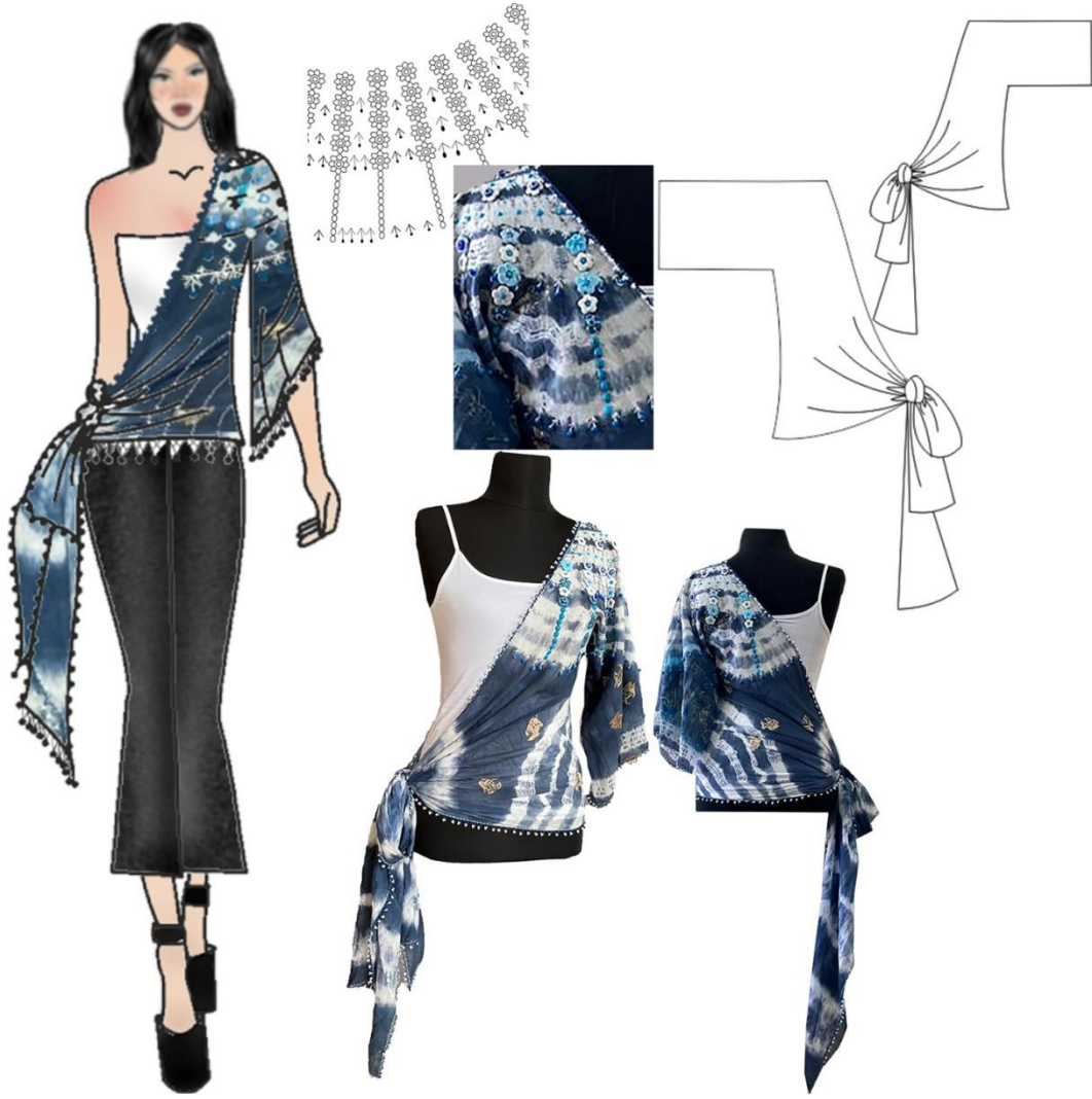
Şekil 7. Tasarım 5 Basit Nakış Teknikleri ile Süslenmiş Bluz Tasarımı

Tasarım 5'te basit el nakış teknikleri asimetrik kesimli bir bluzaya uygulanmıştır. Giysi bağlama batık yöntemiyle desenlendirilen beyaz tül bent kumaştan kesilmiştir. Bluz, ön ve arka bedende sol omuzdan kalça hattına kadar verev kesimli bir yakaya sahiptir. Giyside sağ beden kalça hattına kadar açık kalacak şekilde tasarlanmıştır. Sol ön ve arka bedende omuzdan kalçaya doğru verev kesimli gelen parça uzun kesilerek kalça hattında birleştirilip düğümlenmiştir. Kimono kol formunda olan kollarda model boyu dirsek hattında olup kol ağzı geniş çalışılmıştır. Giyside basit nakış ile yapılan süslemeler bağlama batık ile oluşturulan desenler referans alınarak oluşturulmuştur. Giyside basit nakış teknikleri farklı boncuk türleri ile desteklenerek işlenmiştir. Bluzda sol omuzda yoğunluklu olarak kullanılan camdan çiçek şeklinde olan boncuklar papatya iğnesi tekniği ile giysiye işlenmiştir. Çöp işi giyside desenler arasına boncukla desteklenerek işlenmiştir. Yaka kol ağzı ve etek ucu tığ ile boncuklu tül bent kenarı temizleme tekniği ile temizlenmiştir.