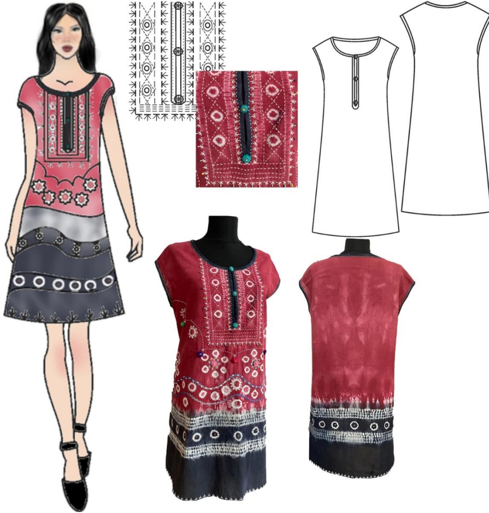
Şekil 8. Tasarım 6 Basit Nakış Teknikleri ile Süslenmiş Elbise Tasarımı

Tasarım 6'da basit el nakış teknikleri simetrik kesimli bir elbiseye uygulanmıştır. Elbisede bağlama batık yöntemi ile desenlendirilen pamuklu bir kumaş kullanılmıştır. Elbise yakası oyuntulu sıfır yaka olup yakada, ön ortasında göğüs hattının altına kadar yırtmaç çalışılmıştır. Yırtmaç elde içi elyaf doldurularak hazırlanan üç düğme ile kapatılmıştır. Kollar düşük kol formunda kısa kol olarak çalışılmıştır. Yaka çevresi, yırtmaç çevresi ve kol ağzı biye ile temizlenmiş biye üzeri oyulgama dikişi ile hareketlendirilmiştir. Giyside özellikle ön beden yaka yırtmaç çevresinde yoğunlaşan basit nakış teknikleri, bağlama batık ile oluşturulan desenler referans alınarak geometrik formlarda işlenmiştir. Giysi süslemesinde basit nakış tekniklerinden oyulgama dikişi, "Y" iğnesi, çöp işi teknikleri kullanılmıştır. Ayrıca basit nakış teknikleri farklı renklerde ahşap boncuklarla hareketlendirilmiş, elde hazırlanan biye kordon tutturma tekniği ile giysiye uygulanarak süsleme detaylandırılmıştır.