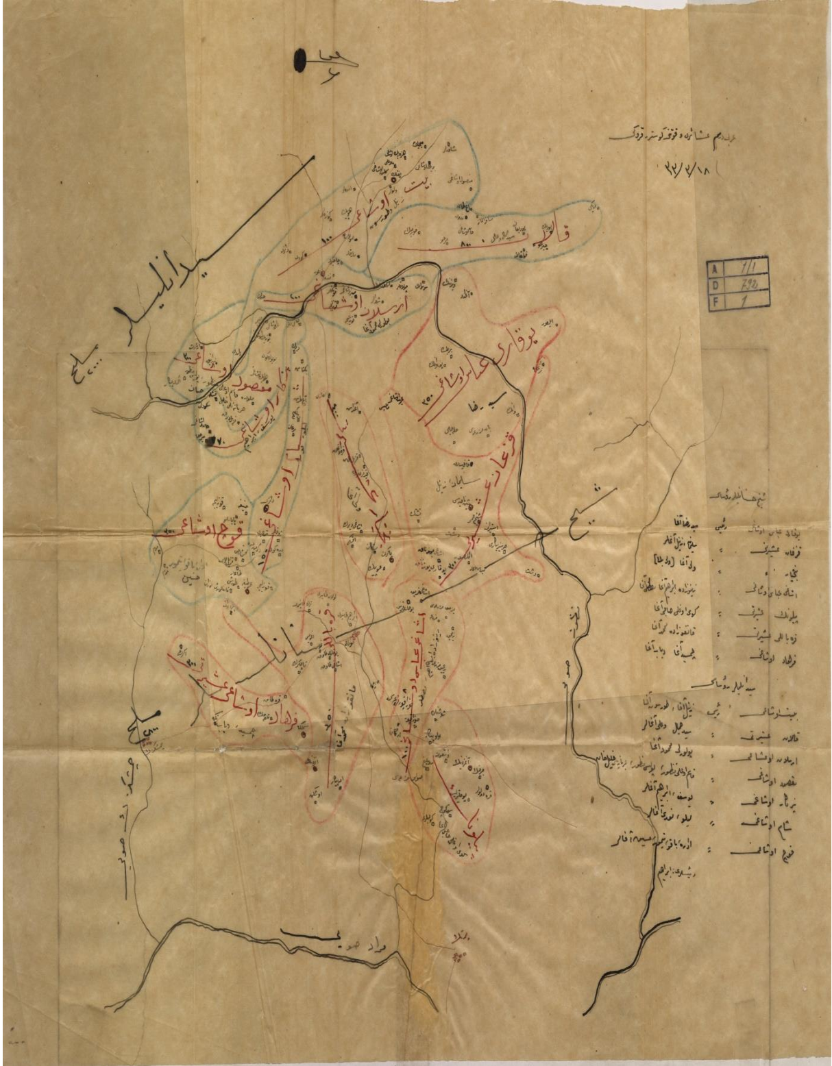
ATASE. BDH. K.N. 202-792, Y.D.N. 848, Fih. 1.