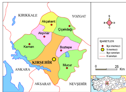
Şekil 1. Kırşehir İli ( https://www.milliyet.com.tr/egitim/kirsehir-haritasi-kirsehir-ilceleri-nelerdir-kirsehir-ilinin-nufusu-kactir-kac-ilcesi-vardir-6310002 , 2020)

Kırşehir, Anadolu bozkırının ortasında sanatın ve kültürün merkezi özelliğine sahiptir. Ahilik geleneğinin oluşumu ve yayılımının sağlandığı yer kabul edilen Kırşehir, çeşitli kültürel unsurlara da ev sahipliği yapmaktadır. Türk Edebiyatı'nın öncülerinden olan Âşık Paşa, gökbilim, islam hukuku, felsefi tasavvufi bilginlerden Cacabey ve birçok âlime ev sahipliği yapan il olarak sayılmaktadır (Maral ve ark. 2020, s. 13).