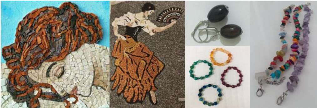
Şekil 4. Taş malzemeye yapılan ürünler (Zehra Ermen, Neşet Ertaş Kültür Merkezi) (Cansız, 2020)

İnsanlık tarihinin en uzun devri olan taş devrinde, insanların ağaç kovuklarında, mağaralarda yaşadığı da bilinmektedir. Bu devrin adından da anlaşılacağı gibi kullanılan eşyalar taş ya da kemiklerdir. Bu araçların, ham halde bulunan taş ve kemikten kesici ve delici şekilde yontularak yapıldığı bilinmektedir. Taş o zamanlarda avlanmak ve korunmak için yapılırken, günümüzde ise çok farklı alanlarda daha ince işçilikle kullanılmaya başlanmıştır. Kırşehir Halk Eğitim Merkezinde hammaddesi taş olarak işlenen ürünler, günlük hayatımızda kullanılan aksesuarlardır. Bu merkezde açılan kursta, çoğunlukla takı ve mozaik taş süsleme ürünler yapılmaktadır. Kursiyerlere, eğitmenler tarafından taşın kullanım yerlerine göre alınıp, işlendiği bilgisi öğretilmektedir. Bu kursta kursiyerler, zevklerine ve kullanacakları yerlere göre ürünler yapmaktadırlar. Bu ürünler, çoğunlukla tablo ve aksesuar (küpe, bileklik, kolye) şeklinde kursiyerler tarafından yapılmaktadır (Şekil 4). Bu kurslarda kullanılan takı malzemeleri doğal taşlardan oluşmaktadır. Kadınların takıya olan ilgileri onların bu kursa olan katılımlarını arttırmıştır. 2015'ten beri faaliyetini sürdüren bu kurs, son yıllarda kursiyerler tarafından daha çok ilgi görmektedir (Ermen, Z., Sözlü görüşme, 2020).