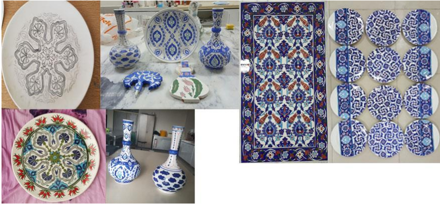
Şekil 6. Toprak malzemeye yapılan ürünler (Cengiz Durmuş, Neşet Ertaş Kültür Merkezi) (Cansız, 2020)

Hammaddesi toprak olan kurslardan bir diğeri de çinicilik kursudur. Geleneksel Türk sanatlarından biri olan çini günümüze kadar gelmeyi başarmış sanatlarımızdandır. İçinde bulunan toplumun özellikleri, karakteri eserlerde kendini göstermektedir (Erdem, 2019, s. 1). Bu sanat, doğallığından ve dikkat çekiciliğinden dolayı birçok Osmanlı saraylarında, mimari eserlerde ve hediyelik eşyalarda kullanılmıştır. Günümüzde de halen çeşitli illerde de açılan kurslarda da bu sanatı devam ettiren ve öğretici eğitimciler bulunmaktadır. Kırşehir Halk Eğitim Merkezinde de çini sanatı devam ettirilen ve kursiyerler tarafından ilgi gören kurslardandır. Bu kursta vazo, tabak, pano, tabak pano ve çeşitli ürünler yapılmaktadır (Şekil 6) (Durmuş, C., Sözlü görüşme, 2020).