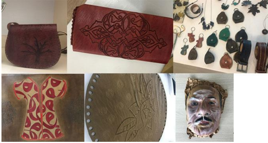
Şekil 7. Deri malzemeye yapılan ürünler (Oğuz Alim Orkun, Neşet Ertaş Kültür Merkezi) (Cansız, 2020)

Tarihten günümüze kadar olan dönemlerde el sanatlarımızın nasıl ortaya çıktığı ve günümüze kadar gelmeleri farklılık göstermektedir. Bu eserlerin, arkeolojik kazılarda ortaya çıkması ve tarihimize ışık tutması açısından kültürel mirasımıza önemli katkılar sunmaktadırlar. Bu eserlerin hammaddeleri toprak ve taş olanlar günümüze kadar ulaşmış olup, doğa şartlarına dayanamayanlar ise kaybolmaya yüz tutmuştur. Türk toplumunun çiftçilik ve tarımla uğraştığı bilindiğine göre, hayvancılıkla uğraşan topluluğun da dericilikle de uğraşabilirlik bilgisi vermektir. Deriyi işlemeyi öğrenen keşfeden insanoglu, deriyi çeşitlendirerek ve kullanım alanlarını genişleterek sanat dalımıza katmaktadır. (Özdemir, 2004, s. 1). Ahilik teşkilatının kurucusu olarak bilinen Ahi Evran Veli'nin bu şehirde yaşadığı ve debbağlık (deri işleme) yaptığı bilinmektedir (Etikan ve ark. 2020, s. 5, Maral ve ark. 2020, s. 13) Bu bağlamda Kırşehir merkezde bulunan Halk Eğitim Merkezi kurslarında bu el sanatı 2018 yılından beri çeşitli ürünlerle yapılmaya devam edilmektedir. Bu ürünler; çanta, cüzdan, kemer, kolye, anahtarlık gibi aksesuarlar, mask, tablo, pano gibi süs eşyalarıdır (Şekil 7). Bu sanatı üretebilmek için kursiyerler hammaddeyi başka illerden temin etmektedirler (Orkun A. O., Sözlü görüşme, 2020).