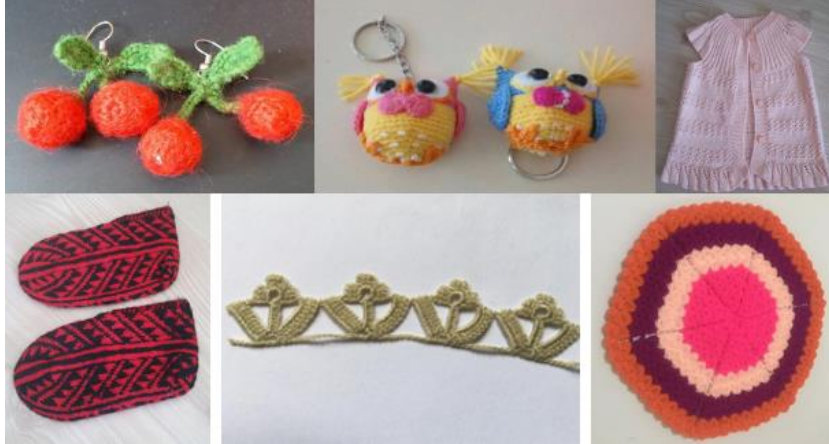
Şekil 2. Hayvansal liflerle yapılan ürünler (Rabia Demir, Neşet Ertaş Kültür Merkezi) (Cansız, 2020)

Birtakım işlemlerden geçirilerek, iplik haline dönüştürülmesiyle elde edilen malzemenin en küçük halinin dokuma, örgü gibi işlerde kullanılması lif olarak tanımlanabilmektedir (Aytaç 1982, s. 3). Bu sınıflandırma hayvansal, bitkisel ve kimyasal lifler olmak üzere 3'ye ayrılmaktadır (Arlı 1990, s. 18-21). Bu kurslarda hammaddesi hayvansal lif olan ürünler yapılmaktadır. Çoğunlukla örgü ve oya işleri eğitimi verilmektedir. Sağlık açısından da doğal malzeme olarak kabul edilen lif, giyim eşyalarında ve aksesuarlarda; küpe, anahtarlık, bebek yeleği, patik, yazma kenarı ve kese şeklinde yapılmıştır (Şekil 2). Kırşehir Halk Eğitim Merkezi ilk açıldığı yıllardan beri lif işleyen el sanatları kursları aktif olarak devam etmektedir (Demir, R. Sözlü görüşme, 2020).