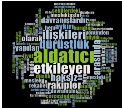
Şekil 1. Haksız Rekabet Kavram Kelime Bulutu

15 katılımcıdan sadece 1 kişi haksız rekabet kavramı ile ilgili tam bilgi sahibi değildir. Diğer 14 kişi haksız rekabet kavramı hakkında yeterli bilgiye sahiptir. Haksız rekabet kavram içeriği irdelendiğinde, tüm katılımcıların meslekte haksız rekabetin yapılmasının suç olduğu, mesleğin saygınlığını yitirdiği, yasa ve yönetmeliklerin haksız rekabeti önlemede yetersiz olduğu, haksız kazanç elde edildiği yönünde düşüncelerinin olduğu tespit edilmiştir. Haksız rekabet ile ilgili muhasebe mesleği kapsamında çıkarılan kanun ve yönetmelikler hakkında katılımcıların çoğunluğunun ilgili mevzuat hakkında bilgisi bulunmaktadır.