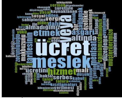
Şekil 3. Haksız Rekabete İlişkin Mali Nitelikteki Uygulamalara Ait Kelime Bulutu

Haksız rekabete neden olan mali nitelikteki uygulamalara ilişkin katılımcılar yeterli bilgi düzeyine sahip olmakla birlikte, katılımcıların çoğunluğu meslektaşlarının düşük ücret tarifesi uygulayarak, hatta bedelsiz iş yapılması sonucu haksız rekabet koşullarının sağlandığı görüşünü savunmaktadır. Bu durum Nvivo 12 programında katılımcıların verdiği cevaplara istinaden oluşturulan kelime bulutunda da ücret kelimesi ile desteklenmektedir. Katılımcılar mali nitelikteki uygulamanın meslektaşları arasındaki en önemli sorunun ücret tarifesindeki sıkıntılar olduğunu özellikle vurgulamaktadırlar.