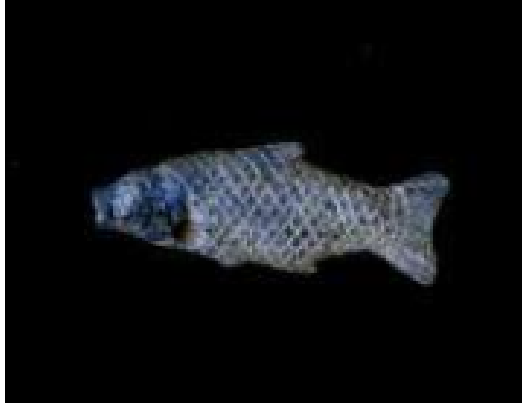
Fotoğraf 15. Lapis Lazuli Balık Biçimli Amulet https://www.britishmuseum.org/