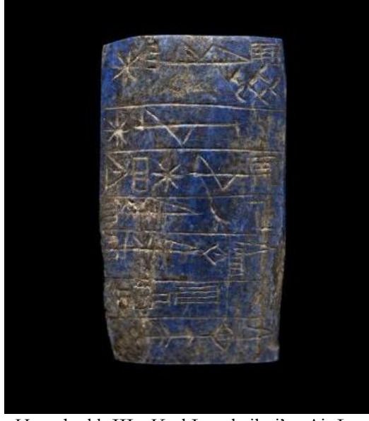
Fotoğraf 13. Erken Hanedanlık III - Kral Lugal-silasi'ye Ait Lapis Lazuli Temel Taşı