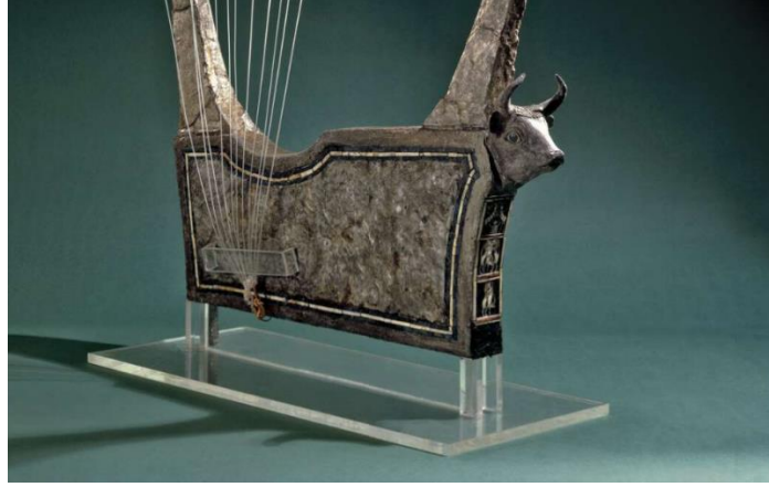
Fotoğraf 10. Ur / Lapis Lazuli Kakmalı Lir