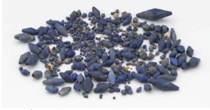
Fotoğraf 4. Ur/Erken Hanedanlık III Dönemine ait Lapis Lazuli Boncuklar