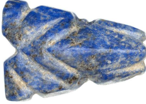
Fotoğraf 14. Ur / Lapis Lazuli Kurbağa Biçimli Amulet