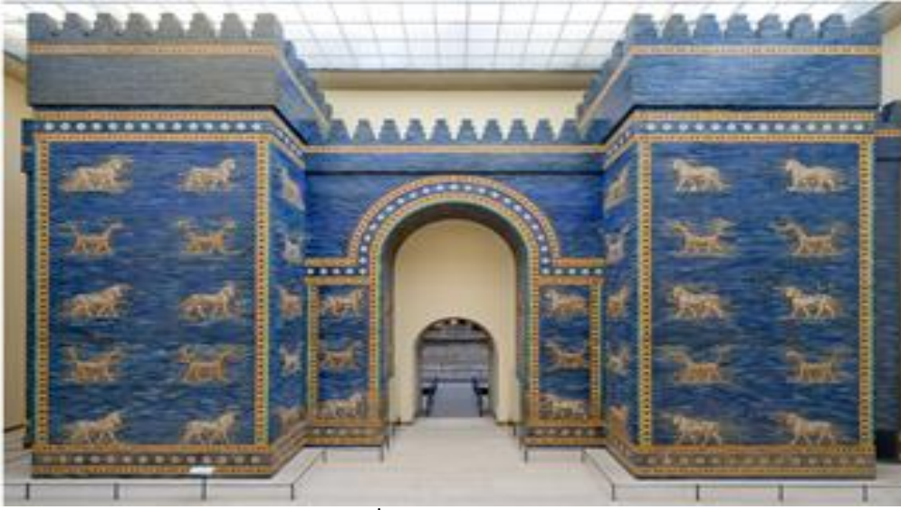
Fotođraf 17. İřtar Kapısı Rekonstrüksiyon https://www.smb.museum/museen-einrichtungen/ Pergamonmuseum/home/