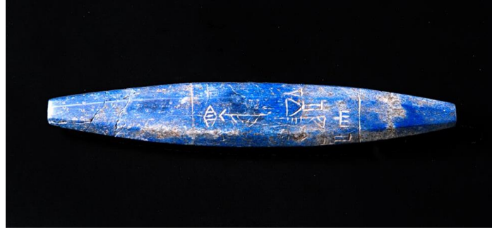
Fotoğraf 2. Ur Kralı Mesannepada'nın Mari Kralı'na Hediye Ettiği Çiviyazılı Lapis Lazuli Boncuk.