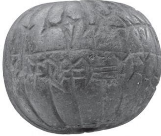
Fotođraf 16. Salmanasar III Dönemine Ait Lapis Lazuli Boncuk (Gries, 2019, s. 149)