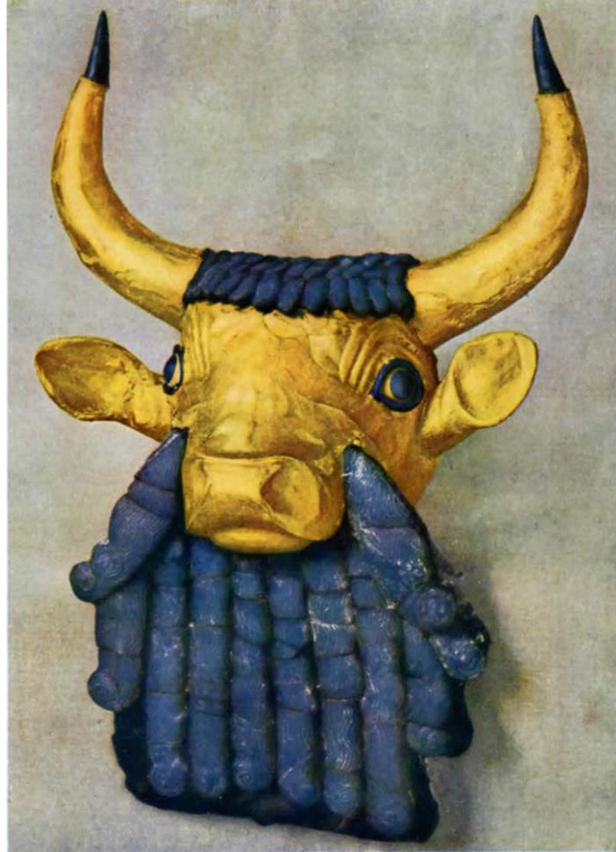
Fotoğraf 11. Ur Lirinde bulunan Altın ve Lapis Lazuli ile Süslenmiş Boğa Başı https://www.penn.museum/