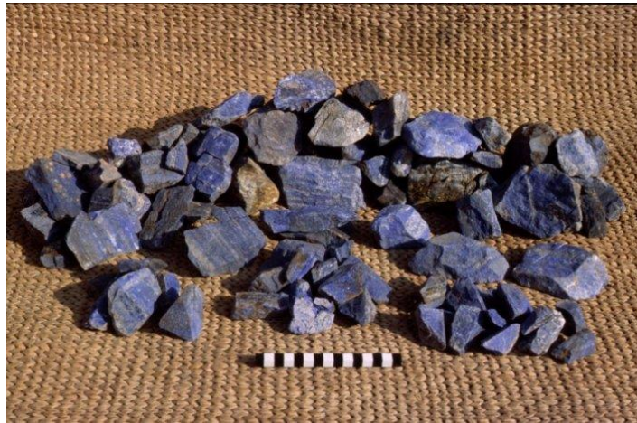
Fotoğraf 3. Ebla G Sarayında Bulunan Lapis Lazuli Parçaları http://www.ebla.it/estoria-del-sito-storia-di-ebla.html