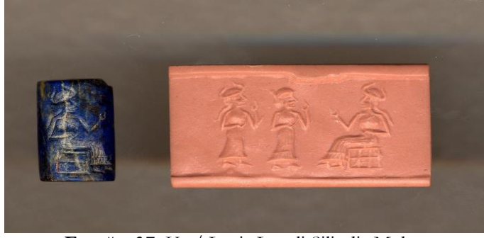
Fotoğraf 7. Ur / Lapis Lazuli Silindir Mühür