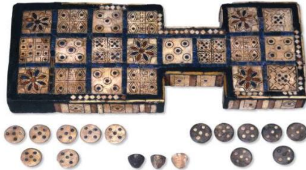
Fotoğraf 9. Ur / Kraliyet Oyun Tahtası