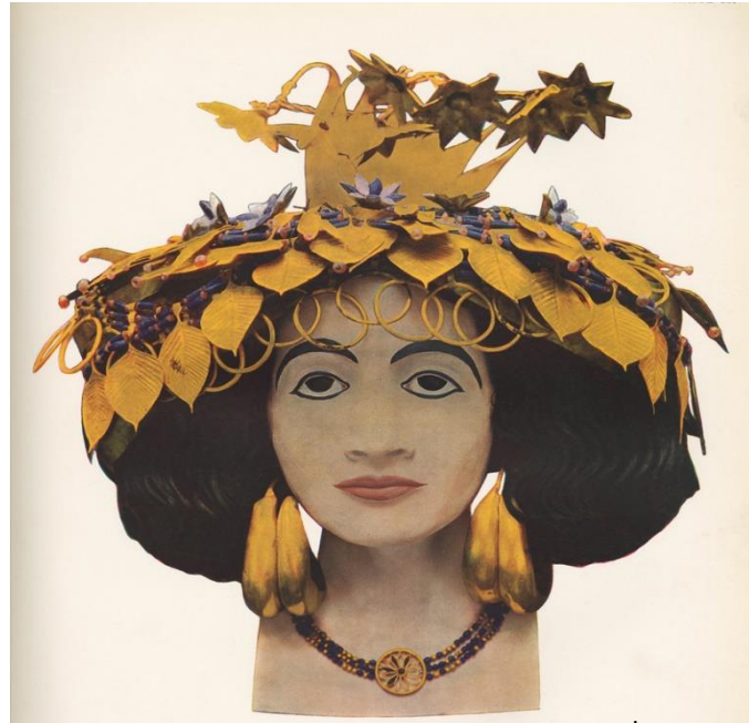
Fotoğraf 8. Kraliçe Puabi'nin Lapis Lazuli ve Altın İşlemeli Tacı https://www.penn.museum/