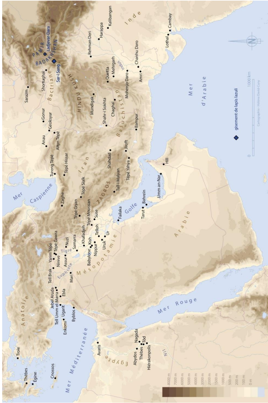
Harita 1. Eski Yakınoğuda Lapis Lazuli Kaynakları (M. Casanova & H. David) https://books.openedition.org/momeditions/8176