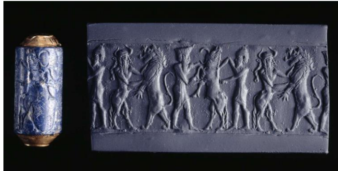
Fotoğraf 6. Ur / Lapis Lazuli Silindir Mühür https://www.britishmuseum.org/