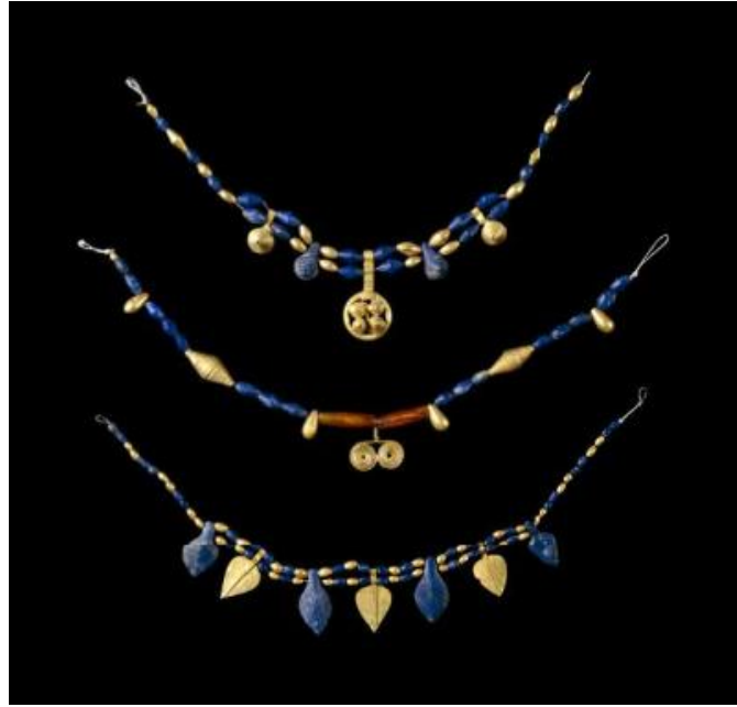
Fotoğraf 5. Ur / Erken Hanedanlık III Dönemine ait Lapis Lazuli ve Altın Boncuklu Kolyeler https://www.britishmuseum.org/