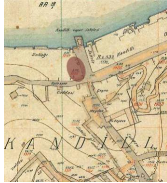
Harita 2: Anadolu Ciheti Haritası'nda Kandilli Camii'nin konumu (Dağdelen, 2008; AA 18/2)