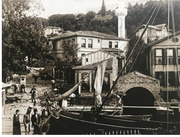
Resim 7: 1900 senelerinde çekilmiş bir fotoğraf (Genim, 2012; 661)