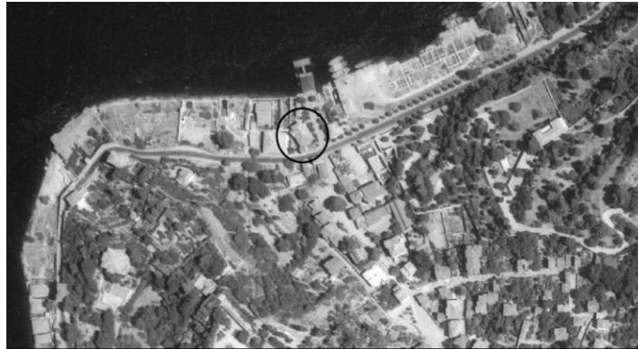
Resim 4: 1954 tarihli Hava Fotoğrafında, Kandilli Camii ve kiremit örtüsü