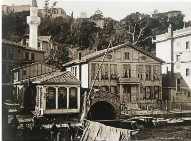
Resim 9: Maurice Meys tarafından 1906 senelerinde çekilmiş bir fotoğraf (Genim, 2012; 663)