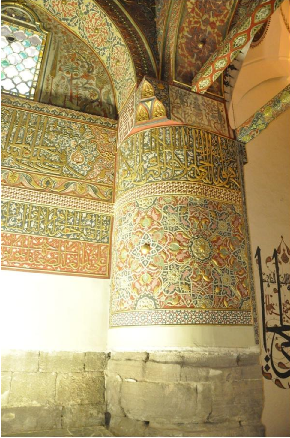
Res. 13 Güney batı fil ayağındaki minyatür resim.