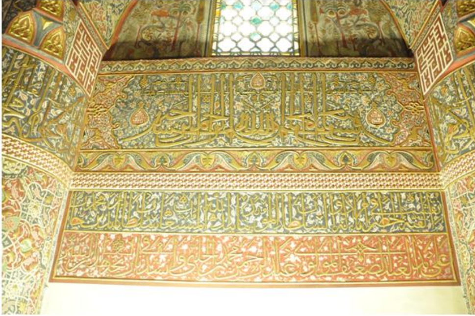
Res. 4 Kalem işlerinin yapım kitabesi.