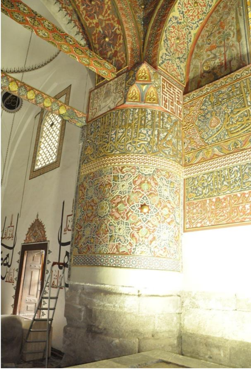
Res. 14 Güney doğu fil ayağındaki minyatür resim