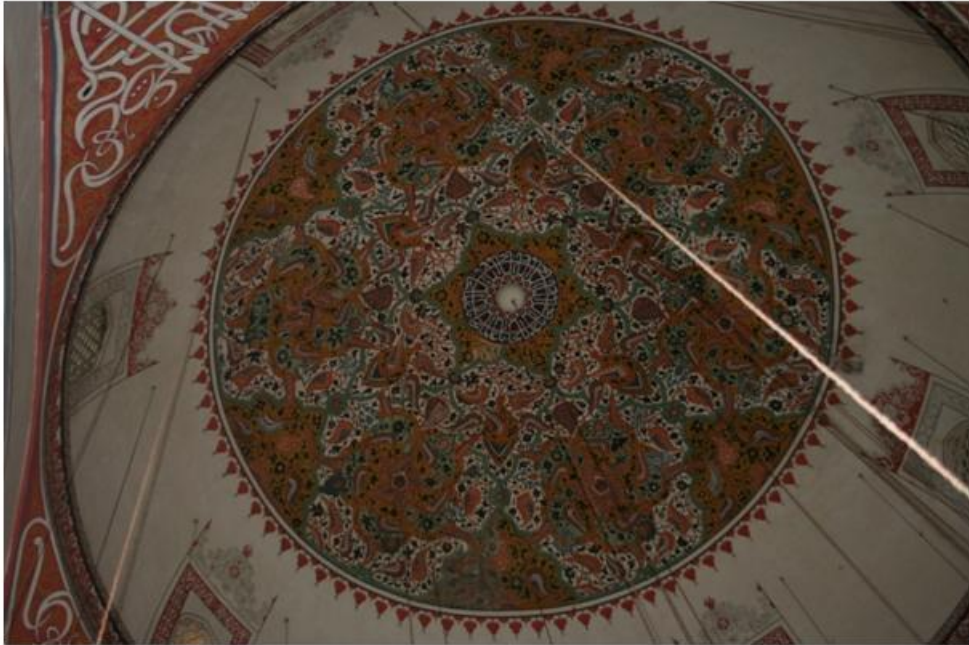
Res. 6 Mahbup Efendinin yapmış olduğu süslemelerin altından çıkan kalem işleri.