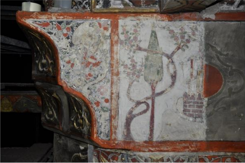
Res. 10 Açığa çıkartılan minyatür resim.