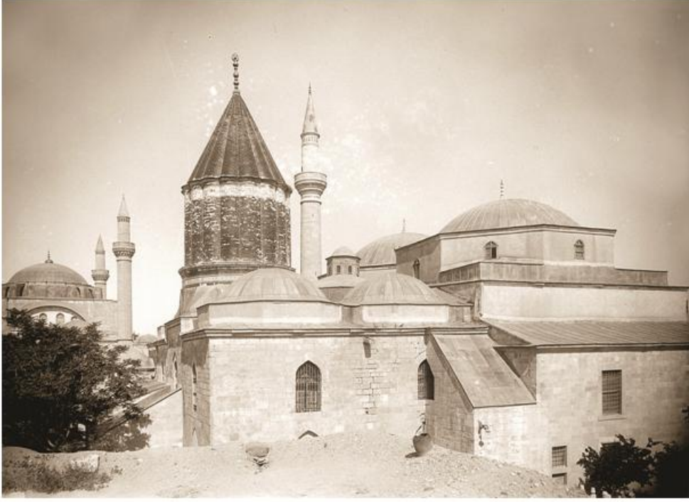
Res. 3 Kubbe-i Hadrâ'nın 1900 lü yıllardan görünümü.