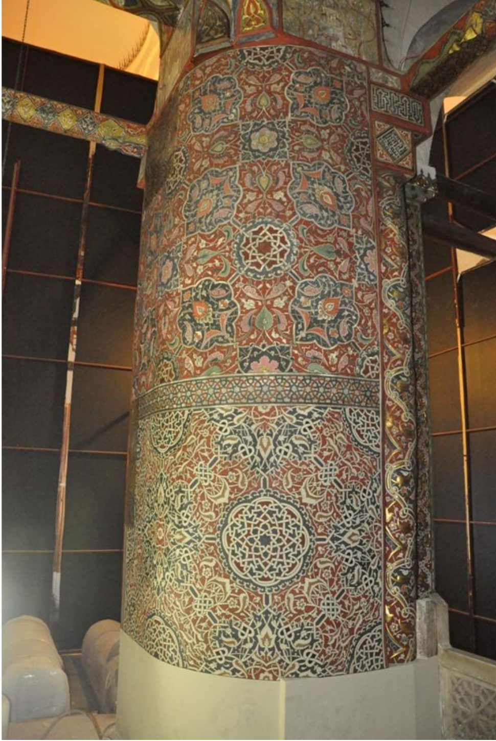
Res. 12 Kuzey doęu fil ayaęındaki minyatür resim.