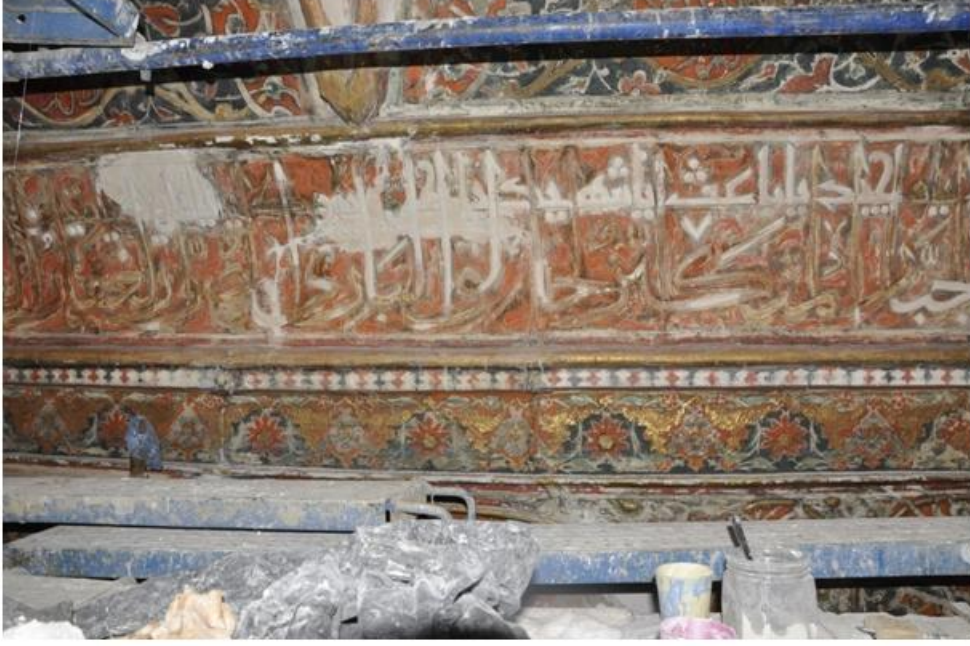
Res. 7 Raspalanan kalem işleri