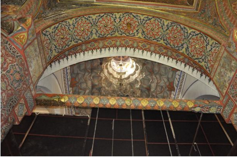
Res. 15 Karřılıklı iki minyatr resim.