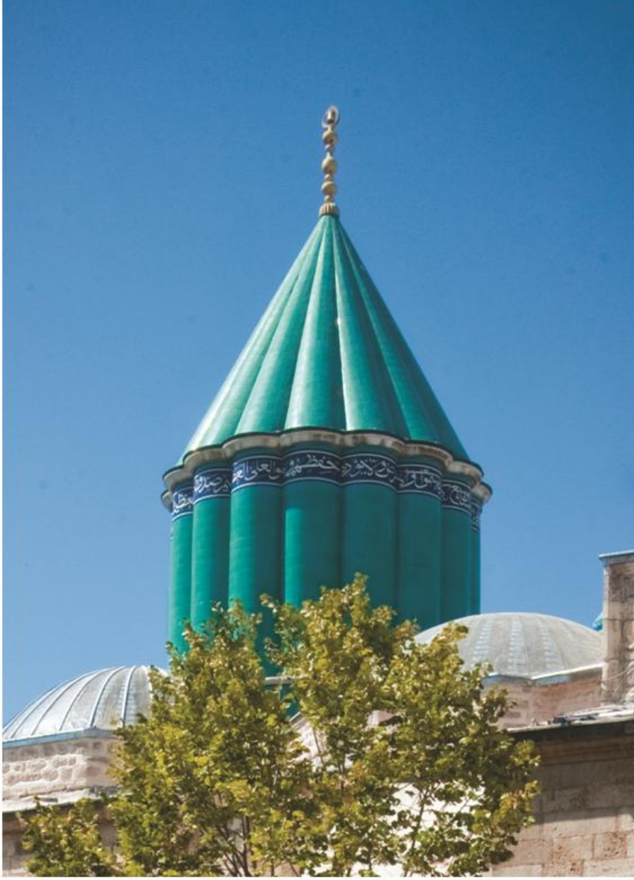
Res. 1 K b be-i Hadr 'nın dıřtan g r n ř .