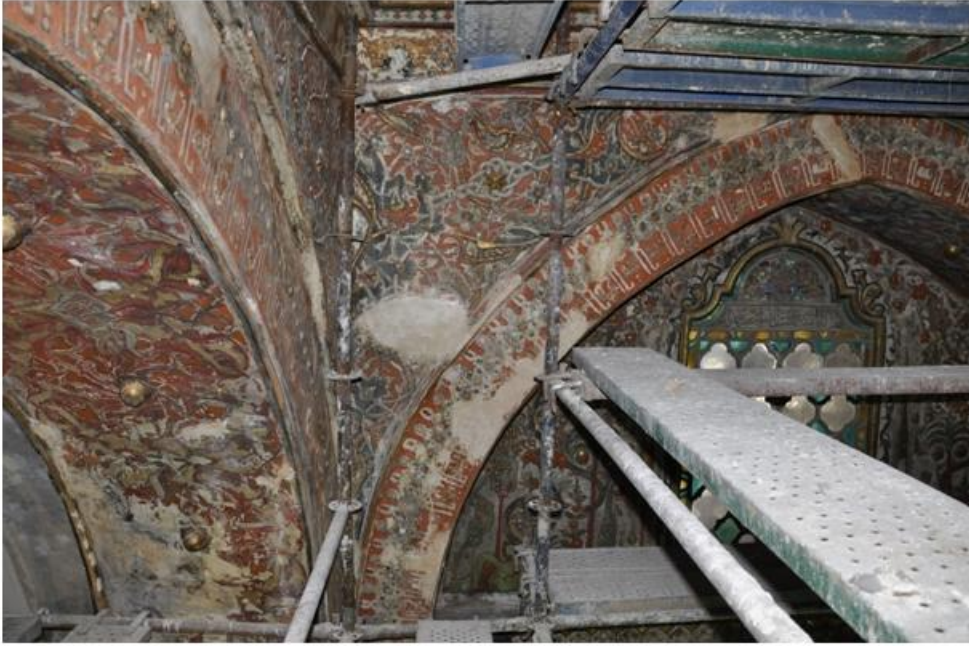
Res. 8 Raspalanan kalem işi süslemeler