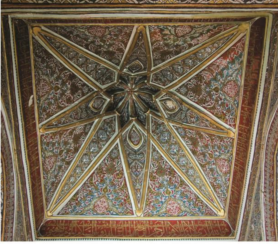
Res. 5 Yıldız tonoz örtünün kalem işi süslemeleri.