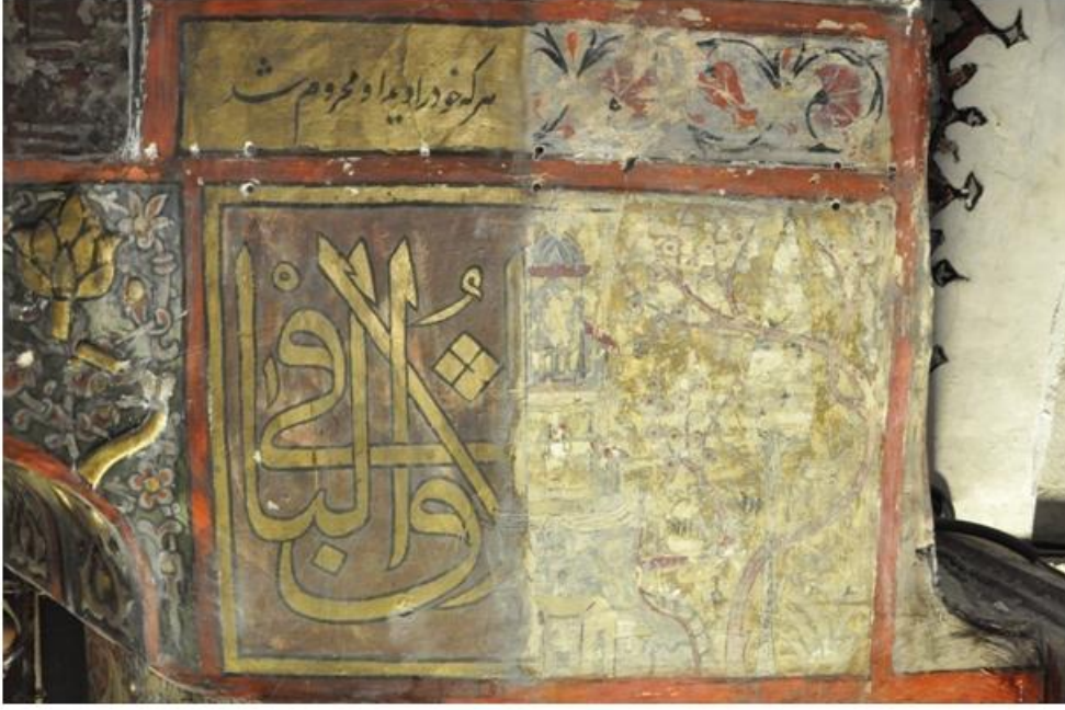
Res. 11 Açığa çıkartılan minyatür resim