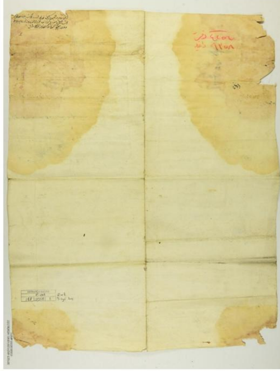
Cevdet Dahiliye (C.DH) 188 – 9358. H.09.08.1099, 3. varak